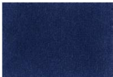
Bleu royal 10690