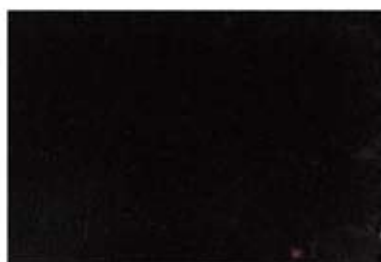
Très noir 10638