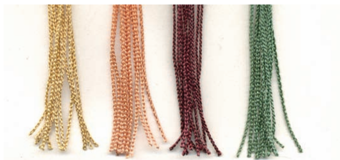
3 jaune 14 abricot 12 rouge 6 vert