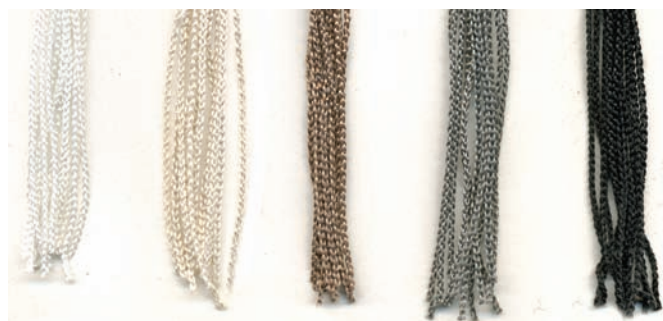
10 blanc 2 beige 4 bronze 32 anthracite 11 noir

Composition : 100 % Polyester - largeur 2,10 m En stock normalement : hauteur 3,20 m - sur demande jusqu'à 20 m Classement : peuvent être ignifugés M1 (attestation valable 1 an).