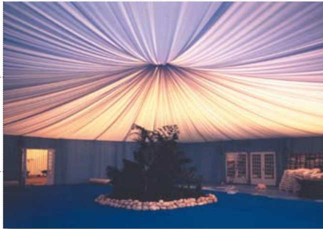
Plissé soleil en coton gratté. Tapis aiguilleté ref. 8571 en filmé.

3250 SERPILLIÈRE - M1 Naturel - 230g/m 2 - Larg. 1,90 m